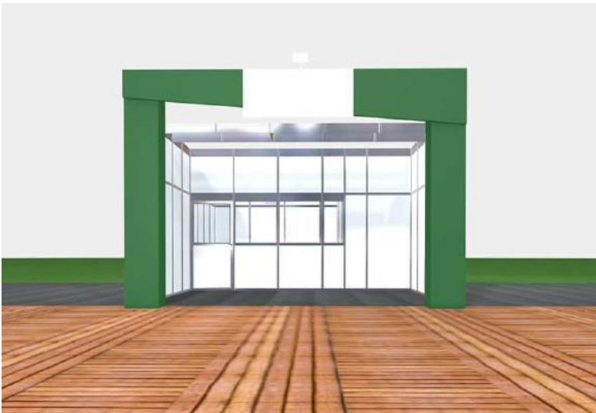
Figura 9: Frente estande