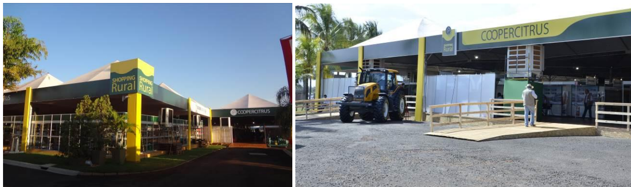
Figuras 1e 2: Vista da fachada Shopping Rural

• Cada estande básico possuirá 18 m 2 e contará com 1 mesa redonda com 4 cadeiras, 01 armário baixo, 2 tomadas na tensão 220 V e 02 testeiras com o logotipo da Empresa. Caso a empresa deseje colocar mais móveis e acessórios, deverá solicitar diretamente à montadora, a qual cobrará um custo à parte.