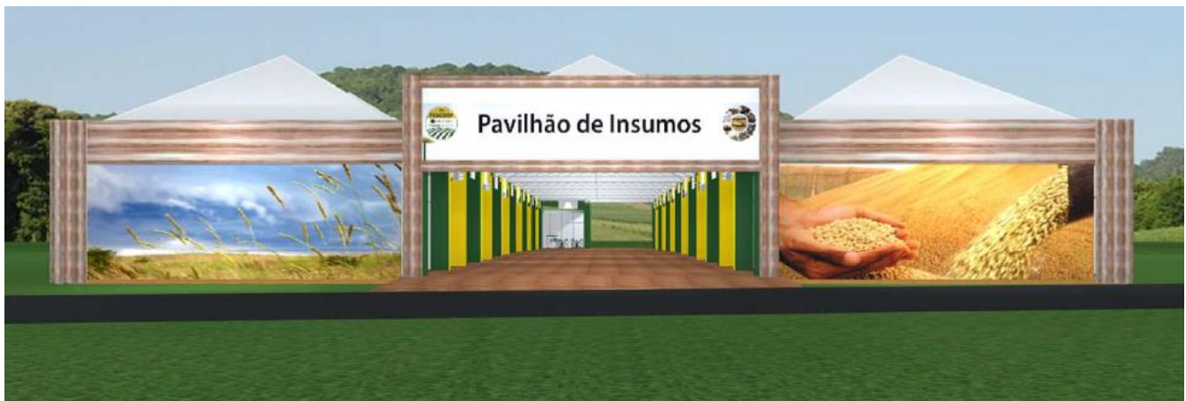
Figura 6: Fachada Área de insumos

Espaço destinado às empresas fornecedoras da Área de Insumos e será composto por 01 estande padrão fornecido pela Coopercitrus com: