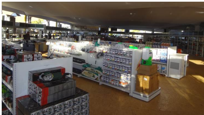
Figura 5: Área de gôndolas

Dimensões: Cada gôndola possuirá espaço para exposição de produtos de 1,30x1,50.