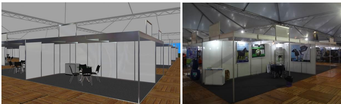
Figuras 3 e 4: Estande 3x6m

• Para os equipamentos de uso geral, é limitado a uma Potência total de 300 W por estande. Na necessidade de mais tomadas ou uso de equipamentos que superem a potência autorizada, favor entrar em contato com Edevaldo Souza Moraes, através do e-mail: edevaldo.engenharia@coopercitrus.com.br / fone (17) 3344-3296.