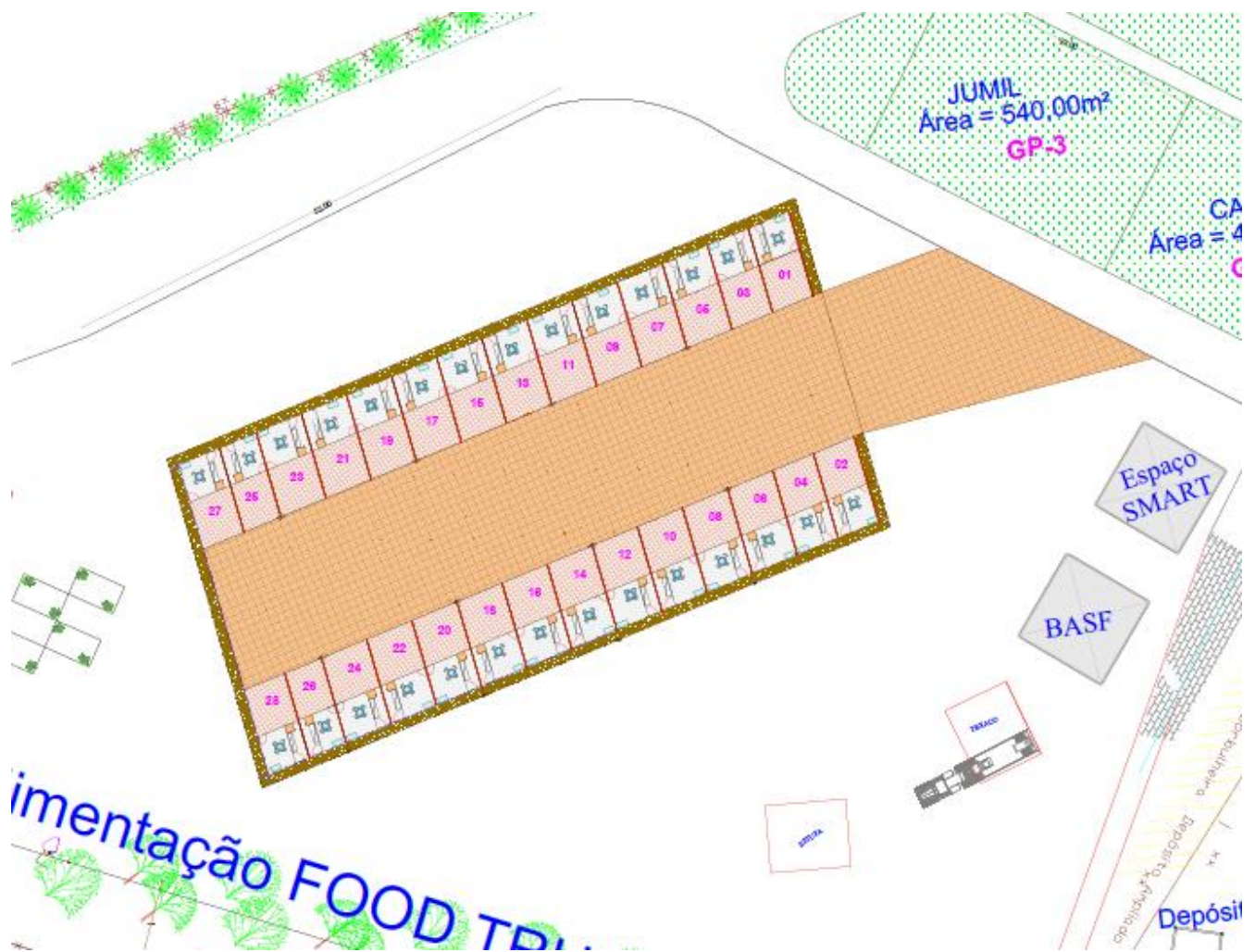
Figura 7: Planta baixa de insumos