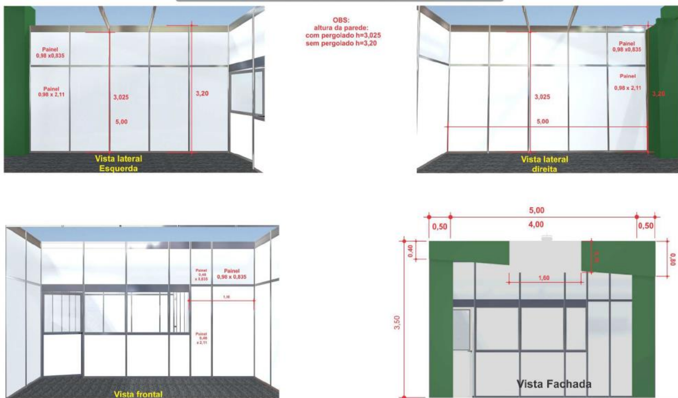
Figura 10: Medidas

Observação1: Para projetos personalizados, a empresa deverá informar com antecedência caso deseje que o espaço não tenha a montagem básica conforme figura acima.